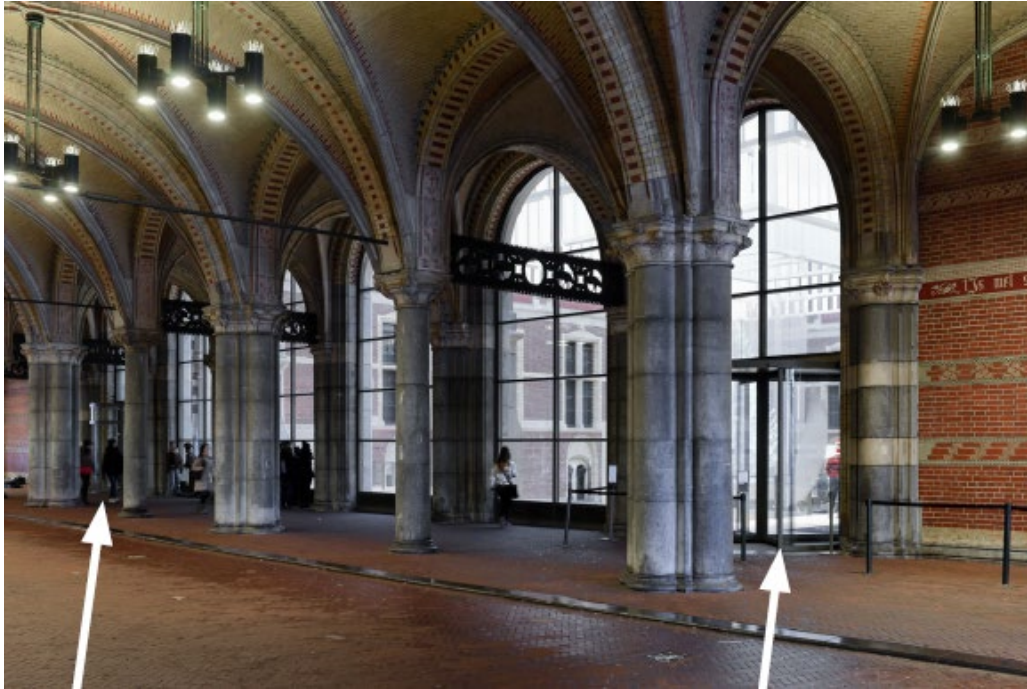
INGANG VIA TRAP

In het midden is het fietspad en aan de zijkanten is de stoep. Vaak fietsen er mensen doorheen en soms zijn muzikanten muziek aan het spelen in de tunnel. In deze tunnel zijn ook de deuren van het museum. Het zijn er vier, drie deuren die bij een trap uitkomen en er is een ingang met een lift.